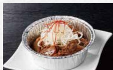
和牛のすじ煮込み 590円(税込649円)