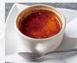
クレームブリュレ 590円(税込649円)