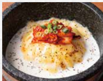
石焼チーズリゾット 790円(税込869円)