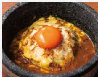
石焼カレービビンバ 690円(税込759円)

ふわたまクッパ ..... 690円(税込759円) 旨辛カルビクッパ ..... 790円(税込869円) 和牛の牛すじ卵かけごはん ..... 490円(税込539円)