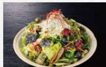
チョレギサラダ 590円(税込649円)