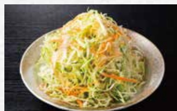
肉専用キャベツ 290円(税込319円)