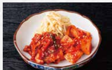
キムチナムル盛り合わせ 590円(税込649円)