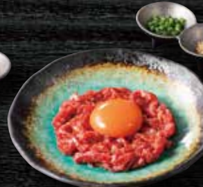
特選 神戸牛のユッケ 1,290円(税込1,419円)