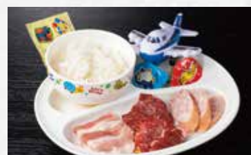
お子様焼肉デビューセット 890円(税込979円)

白菜キムチ ..... 350円(税込385円) カクテキ ..... 350円(税込385円) もやしナムル ..... 290円(税込319円) ほうれん草ナムル ..... 290円(税込319円) サンチュ ..... 390円(税込429円) 焦がしコーンバター ..... 350円(税込385円) にんにくホイル焼き ..... 350円(税込385円) びっくりソーセージ ..... 690円(税込759円) フライドポテト ..... 390円(税込429円) お子様ラーメンセット ..... 690円(税込759円)