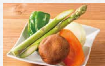
季節野菜の盛り合わせ 590円(税込649円)