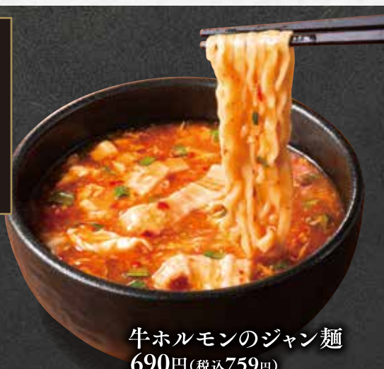
牛ホルモンのジャン麺 690円(税込759円)