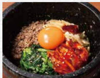
石焼ビビンバ 690円(税込759円)