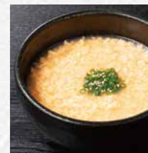
ふわたまスープ ハーフ 290円(税込319円) レギュラー 490円(税込539円)