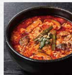
旨辛カルビスープ ハーフ 390円(税込429円) レギュラー 590円(税込649円)

牛すじ塩スープ ..... ハーフ 390円(税込429円) レギュラー 590円(税込649円)