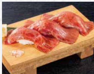
炙り神戸牛握り 890円(税込979円)